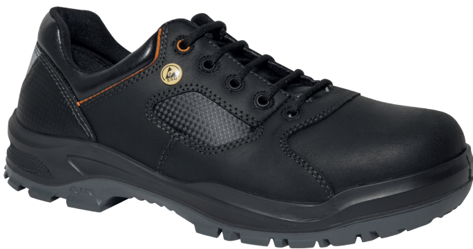
■ 4814 NOIR | 36 ▶ 48