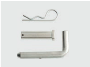
ET38 - ET72